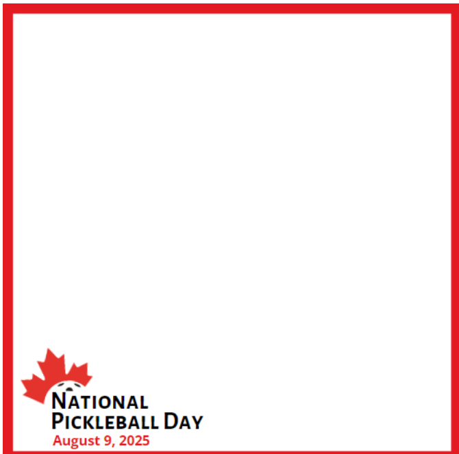
Cadre des médias sociaux - anglais