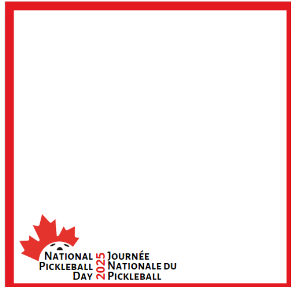
Cadre des médias sociaux - bilingue