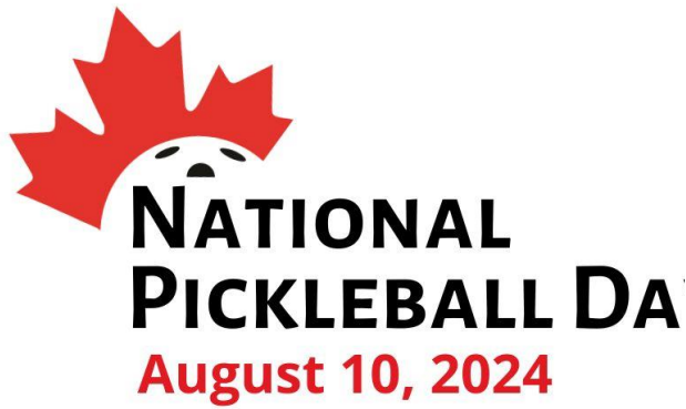
Logo - Anglais