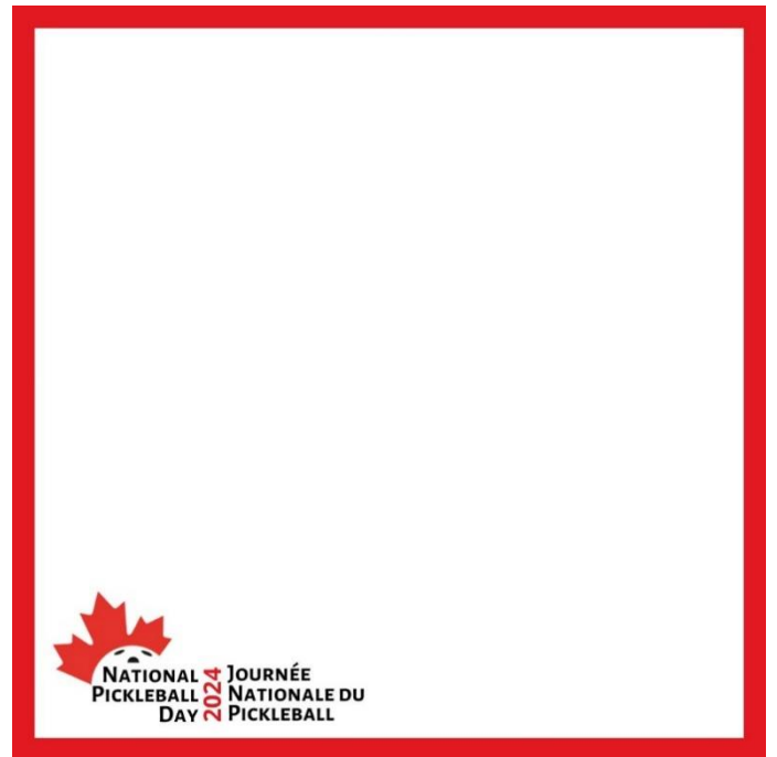
Cadre des médias sociaux - bilingue