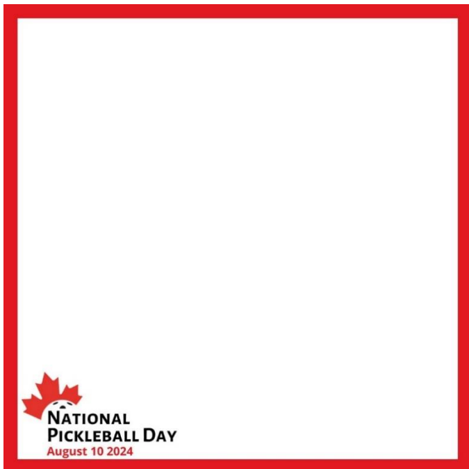
Cadre des médias sociaux - anglais