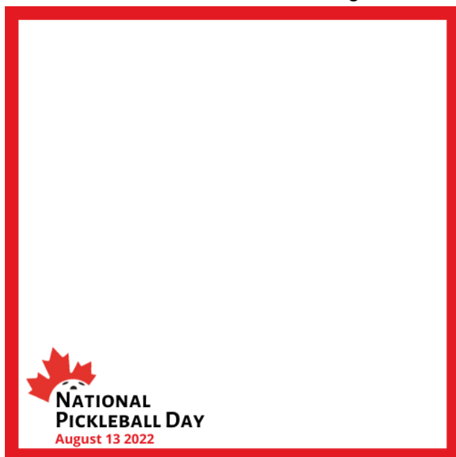
Cadre des médias sociaux - anglais