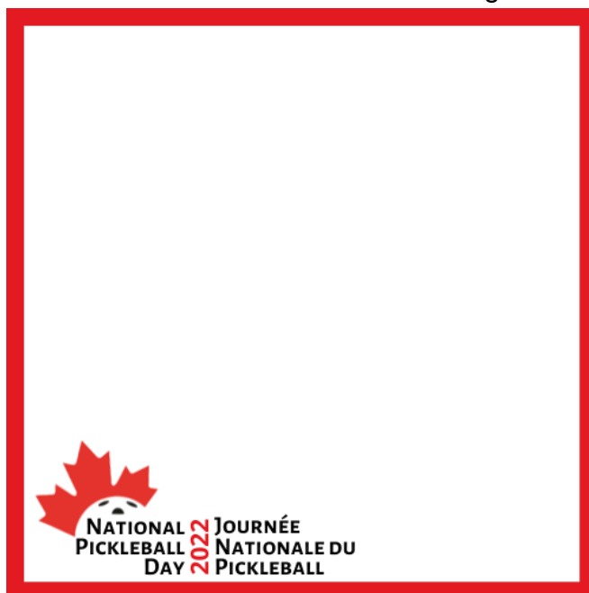
Cadre des médias sociaux - bilingue