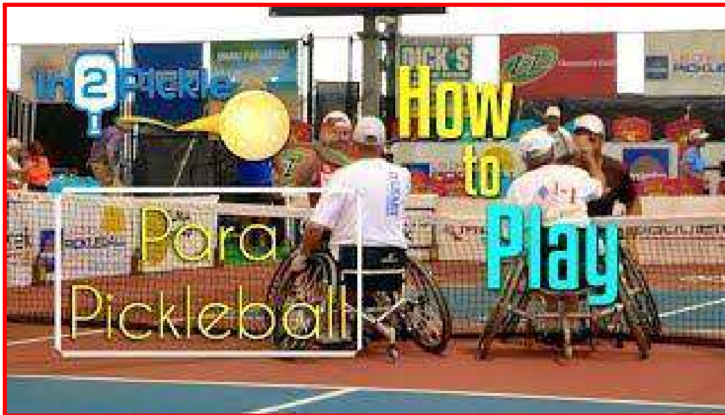
Para Pickleball - Comment jouer

Pour plus d'informations, veuillez contacter Michel Legault. michel.legault@icloud.com